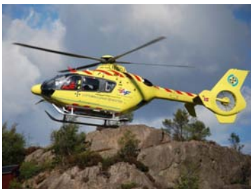
Luftambulansse, type EC 135.